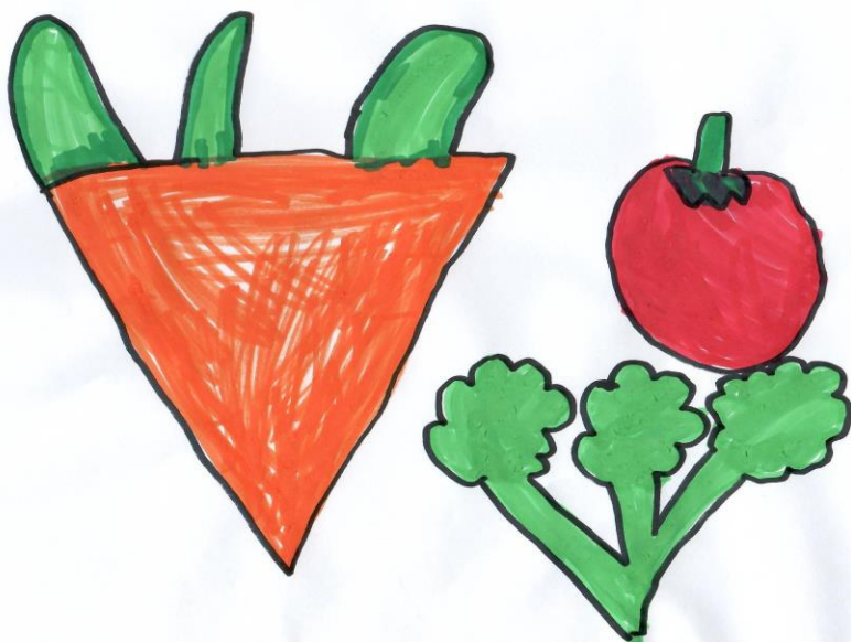
SKUPINSKA RISBA SKUPINE OBLAČKI V ENOTI LENKA/ ZELENJAVA

Otroci do starosti dveh let imajo prilagojeno pripravljene jedi. Med obroki so otrokom na razpolago sveže sadje, voda ali sadni/zeliščni čaj. V jedeh, kjer je posamezno živilo označeno z zvezdico (*), je uporabljeno ekološko živilo . Uporabljamo tudi lokalna živila (med, kruh, jabolka, skuta,...) in živila iz sheme kakovosti.